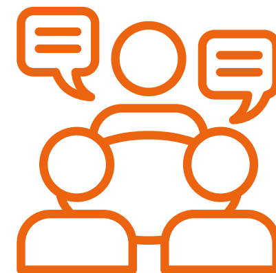
Groupe de parole