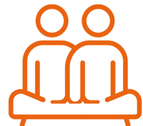
Présence et écoute